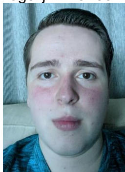
Bart Lammers Website Kampcommissie

Bijna iedere zaterdag en maandag kun leden bij Judoclub Brunssum terecht op de mat. Er worden leuke activiteiten georganiseerd, examens afgenomen, nieuwe banden uitgereikt en nog veel meer. Alles op een ontspannen manier en in een prettige sfeer. Het lijkt eenvoudig, maar er komt een hoop bij kijken. Achter de schermen maakt een grote ploeg mensen dit mogelijk. Hier een overzicht op alfabetische volgorde van de voornaam: