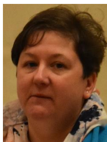
Joyce Ramakers Service punt Examencommissie Ccontactpersoon wedstrijden Activiteitencommissie Kampcommissie